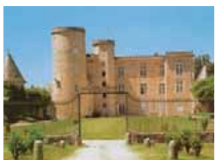
Le château de Cromières

Le corps principal fut construit au XIe siècle. Un escalier à vis de quatre vingt-deux marches, en granit monobloc, s'épanouit dans une voûte d'ogives en palmiers. Lors du passage à Limoges de Charles VII, Martial de Bermondet, le propriétaire des lieux, aurait eu l'honneur d'y recevoir le monarque et de l'inviter à sa table.