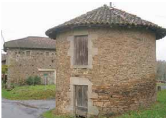
Clédier à Chambinaud