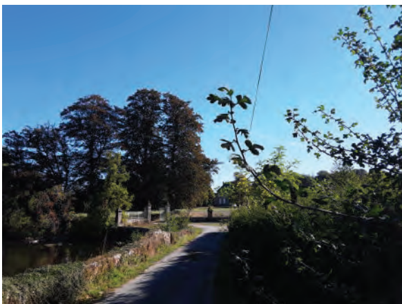
Lieu-dit La Daumarie

L'église romane de Saint-Jouvent, dont le patron est Saint-Gaudens, date du XIIème siècle. L'église fut en grande partie rebâtie au cours du XVème siècle. Le clocher a été érigé en 1897 pour remplacer un petit clocher en bois. Elle abrite notamment une statue de Saint-Roch datant du XVIIème siècle. (Source : Commune)