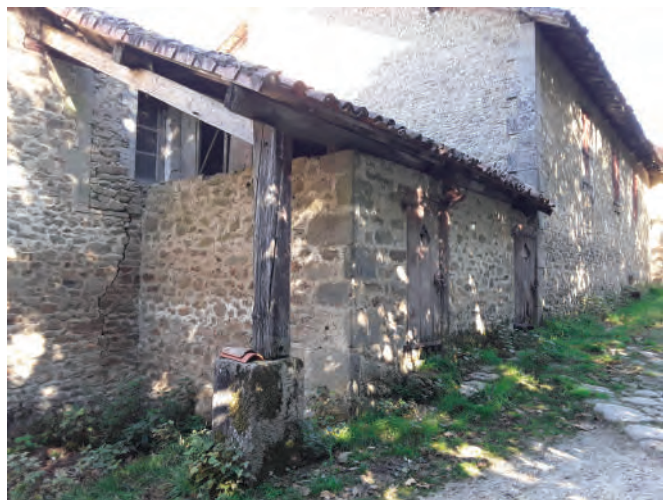
Village des Meynieux

Neuplanchas : de l'occitan nuovas, nouvelles, plancha, large sillon cultivé.