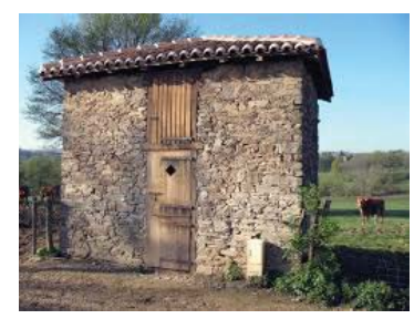
Clédier (séchoir à châtaignes) des Chapelles

Des panneaux proposent des informations sur le patrimoine à observer. A deux pas de la voie verte, profiter d'une balade en famille pour découvrir une zone humide et apprendre son importance pour l'équilibre naturel et celui des hommes. Retrouver quelques spécimens végétaux ou animaux emblématiques de ces écosystèmes indispensables. (source Parc naturel régional Périgord-Limousin)