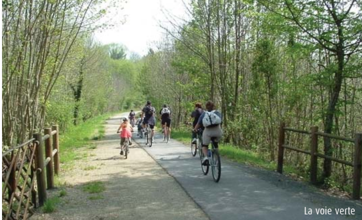
La voie verte