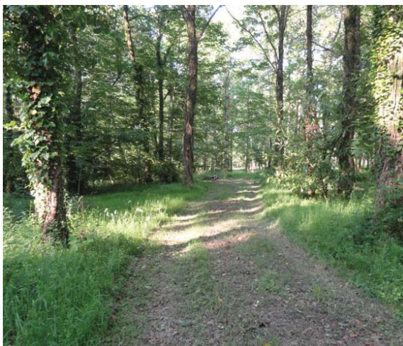
Un chemin du bois des Chapelles

Elle ne comporte aucun tunnel, mais passe sur plusieurs ouvrages d'art, dont les trois ponts à la sortie de Châlus. (Source Wikipédia)