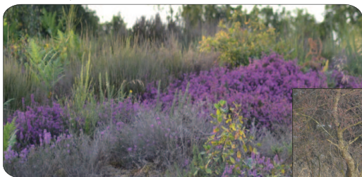
lande de Murat

11 Au croisement, tourner à droite puis prendre à gauche la route qui ramène au point de départ (laisser à droite la direction de Magnac-Laval).