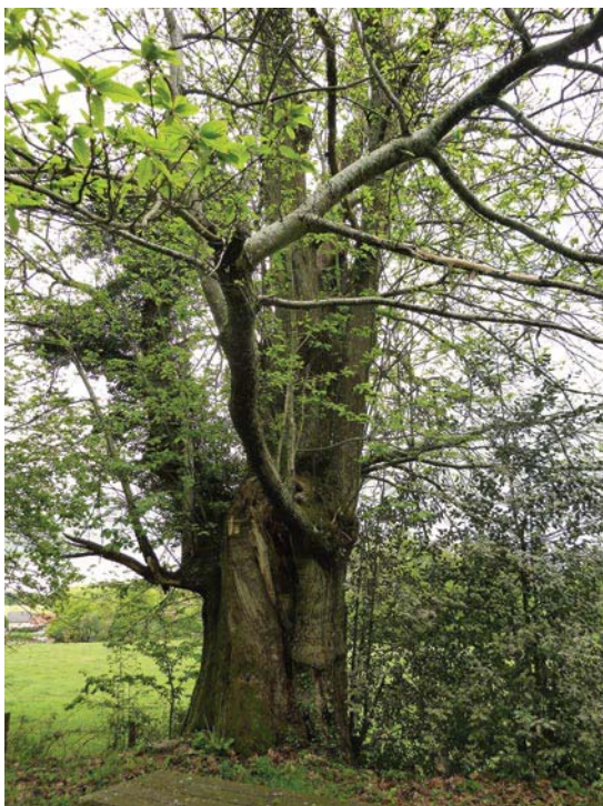
Châtaigniers Petit Jean, âgés de 560 ans