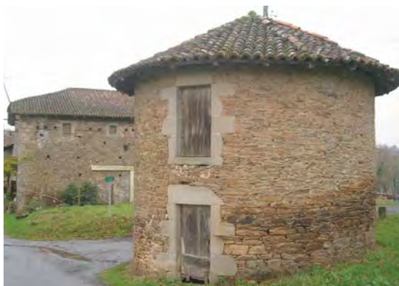
Clédier à Chambinaud