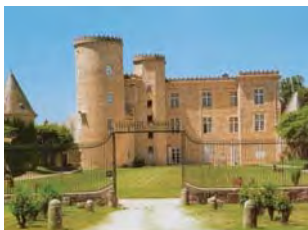
Le château de Cromières

Le corps principal fut construit au XIe siècle. Un escalier à vis de quatre vingt-deux marches, en granit monobloc, s'épanouit dans une voûte d'ogives en palmiers. Lors du passage à Limoges de Charles VII, Martial de Bermondet, le propriétaire des lieux, aurait eu l'honneur d'y recevoir le monarque et de l'inviter à sa table.